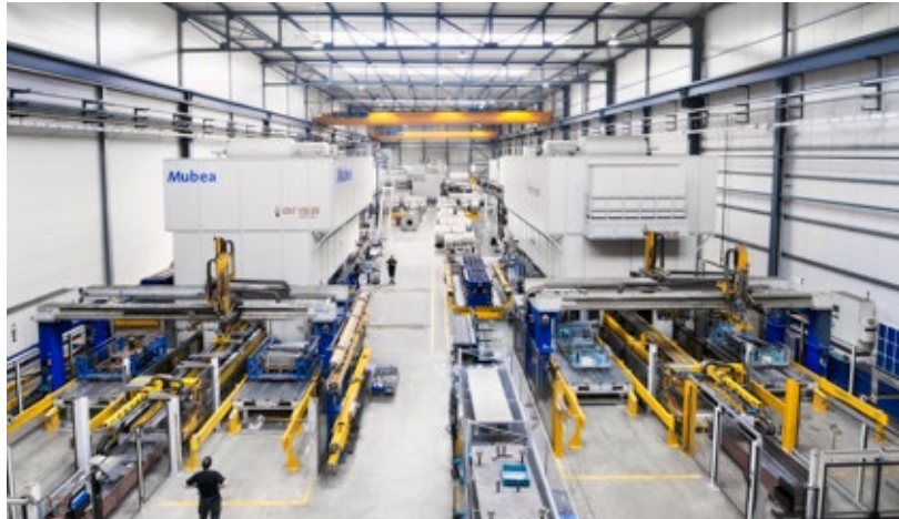
Linea di produzione per prodotti laminati flessibili (Tailor Rolled Products)

presentano però svantaggi evidenti: lo scambio di e-mail non è sicuro né tantomeno idoneo quando si tratta di file di grosse dimensioni. Con il trasferimento FTP le versioni dei file vengono sovrascritte in modo incontrollato, la registrazione dell'operazione di scambio è insufficiente e inoltre è possibile solo l'upload e il download. Poiché PROOM copre al meglio le esigenze specifiche del settore dell'ingegneria meccanica e dell'impiantistica offrendo inoltre un collegamento diretto con PRO.FILE, Mubea si è decisa per questa